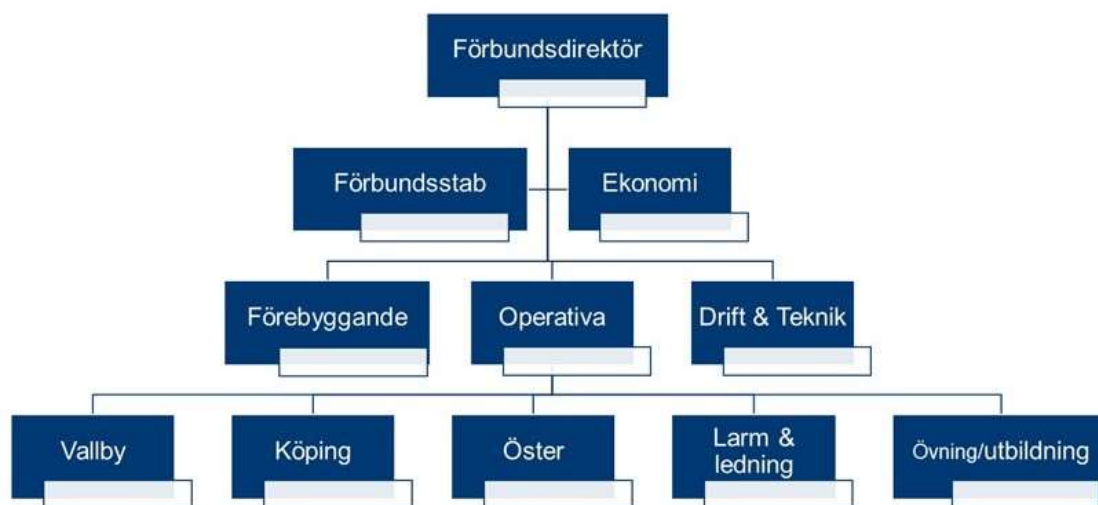
Organisationsstruktur för RTMD