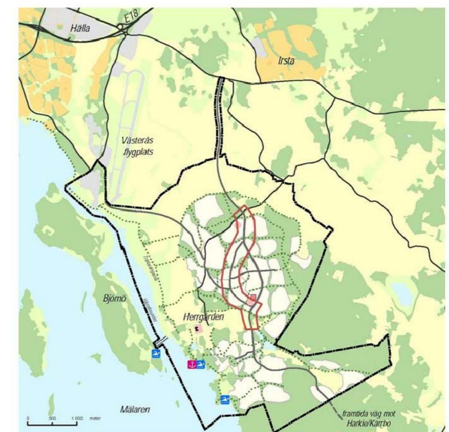
Aktuell vägsträcka markerat i rött