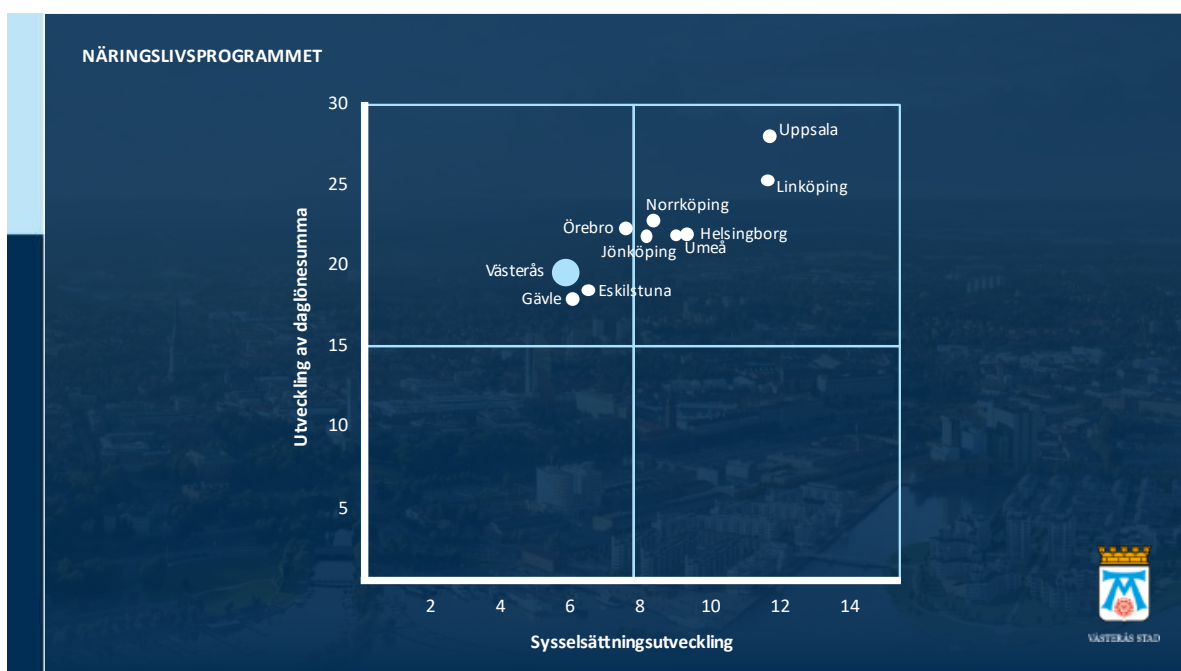
Bilden visar utvecklingen i procent 2017 - 2022

Arbeten med högt kunskapsinnehåll, som är innovativt och produktivitetshöjande, bidrar till en högre lönesumma. Sysselsättningsgraden påverkar också lönesumman, ju fler i arbete desto högre lönesumma. En hög sysselsättningsgrad gynnar alla, allt från den enskilda individen, näringslivet och kommunen utifrån minskade kostnader och ökade intäkter.