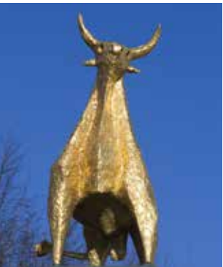
◀ "Tjuren" från 1963 av Allan Runefelt (1922–2005) i förgylld brons – ej att förväxla med en guldkalv. En symbol för styrka.