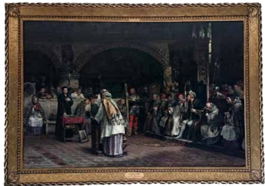
▲ "Religionsamtal mellan Olaus Petri och Peder Galle", vid reformationsriksdagen 1527. Målad 1883 av Carl Gustaf Hellquist (1851–1890) från Kungsör, deposition från Nationalmuseum. Vid reformationsriksdagen i Västerås drev Gustav Vasa igenom beslutet att Sverige som första land i världen skulle bli protestantiskt och att katolicismen som varit statsreligion sedan 1000-talet skulle avskaffas. Det blev även slutet för dominikanklostret i Västerås.