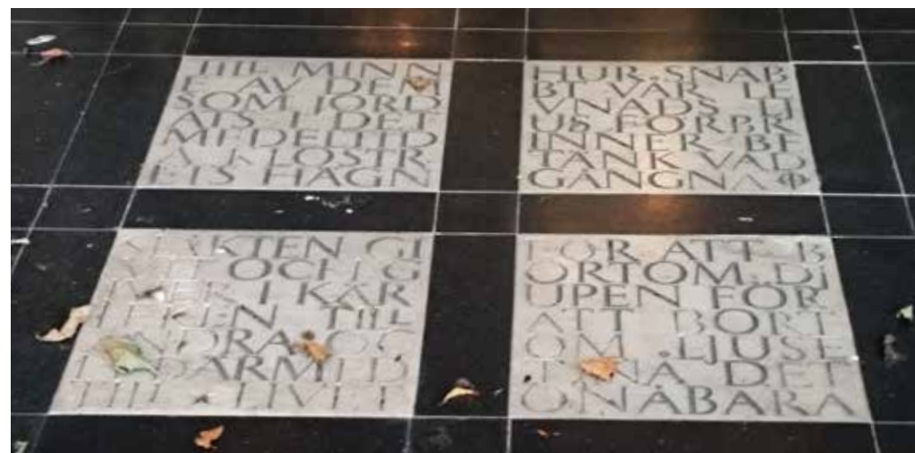
▼ På golvet i minnesrummet innanför "Kopparportarna" finns en text av Bo Setterlind (1923–1991): "Till minne av dem som jordats i det medeltida klostrets hägn. Hur snabbt vår levnads ljus förbrinner betänk vad gångna släkten givit och giver i kärleken till andra och därmed till livet. För att bortom djupen för att bortom ljuset nå det onåbara."