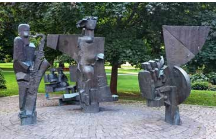
▲ Bronsskulpturen "Borgarna" av Olle Adrin (1918–1988) tillverkad 1957–1961, med "pensionären" som spelar saxofon, "kronbruden" – kvinnan som livets sammanhållande och väsentliga faktor, "atommaskinen" där klotet symboliserar såväl atomen som jorden och "rymdmaskinen" med Pythagoras sats ingraverad.