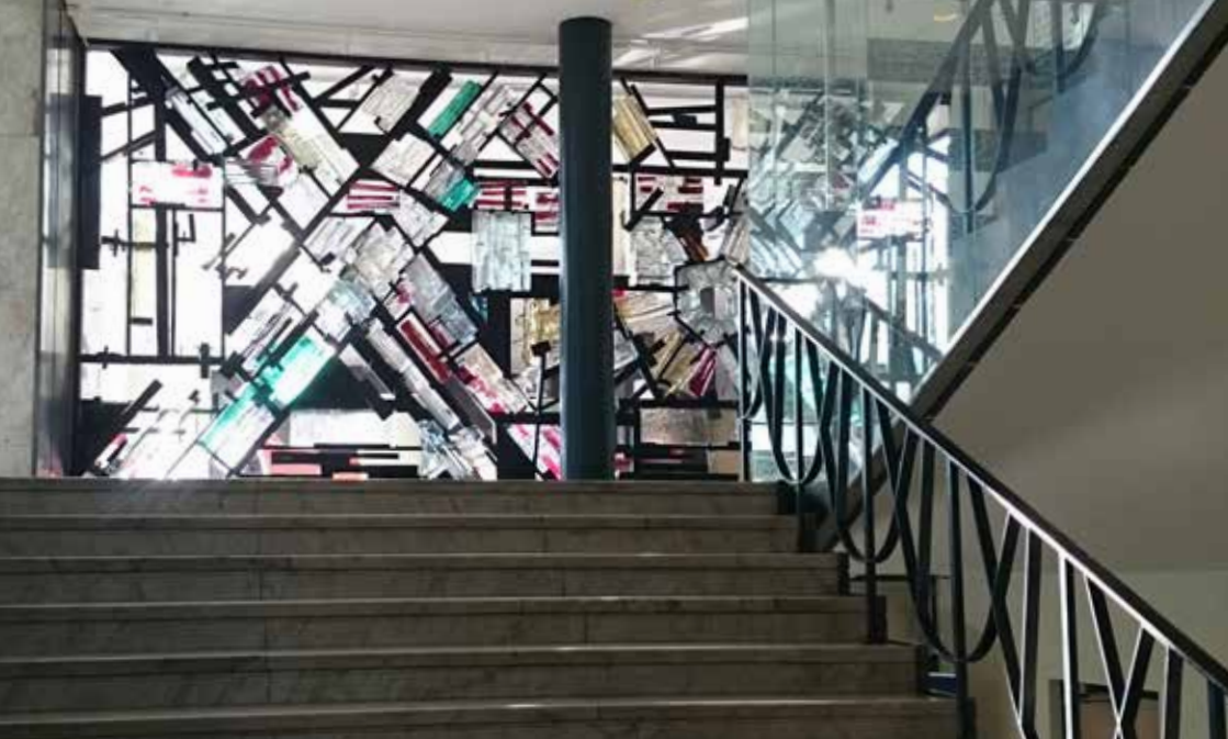
▲ Glasväggen mellan entrén och foajén före kommunfullmäktigesalen heter "Ljuset" och blev klar 1965. Den är gjord av konstnären Edvin Öhrström (1906–1994) som också har skapat glasobelisken "Kristall, vertikal accent i glas och stål" vid Sergels torg i Stockholm.