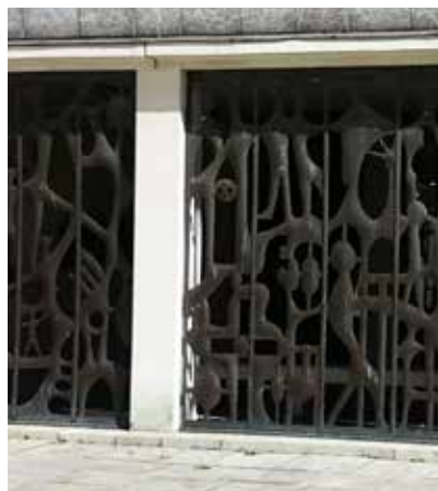
▲ I den del av stadshuset som vetter mot Vasaparken har delar av ruinerna från klostret sparats eller rekonstruerats. Vid en av flyglarna finns ett minnesrum. "Kopparportarna" från 1978 är av kopparplåt och utformade av K G Lindholm (1919–1979). På väggen inne i rummet finns bronsreliefer av Sven Lundquist (1918–2010).