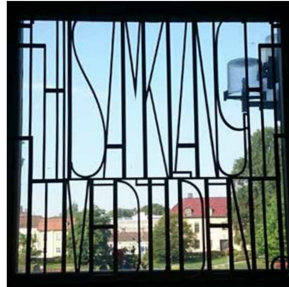
◀ "I samklang med tiden" – Birger Halling (1907–1996) fick formge både trappräcken och husets motto av poeten Bo Setterlind (1923–1991) i ett av entréns fönster.