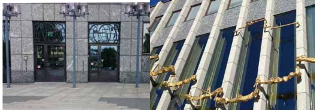
▲ De svarta plattorna utanför stadshuset visar var klosterkyrkans entré låg. ◄ Plan över dominikankonventet. Finns vid ruinerna i Vasaparken.