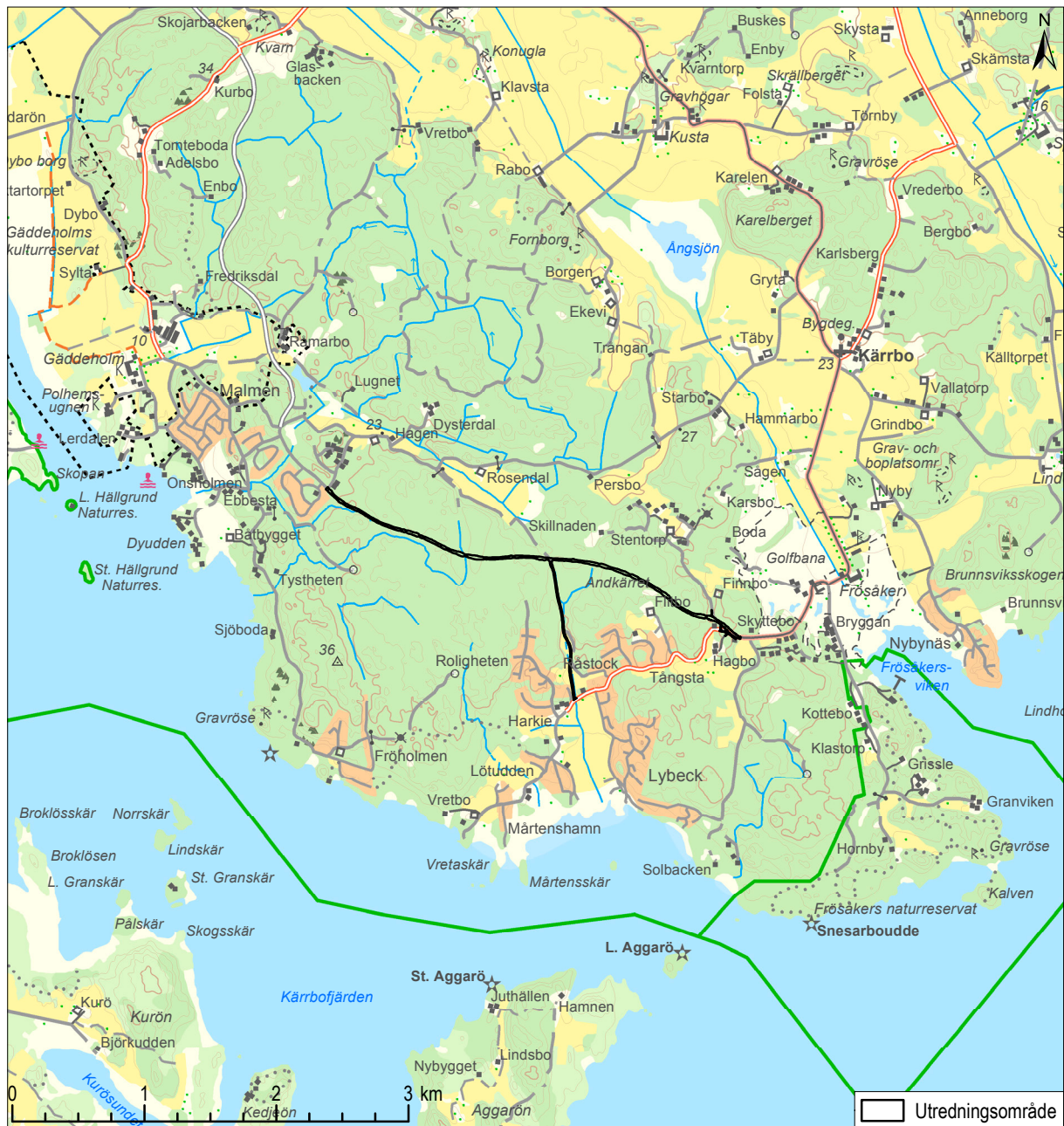
Figur 1. Terrängkartan med utredningsområdet. Skala 1:50 000.