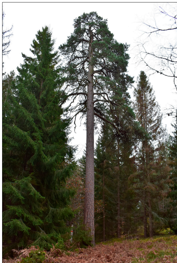
Figur 3. Stora tallen (L2020:10709), cirka 25 meter hög och runt 200 år gammal. Foto från V.

Historiskt kartmaterial från 1600-talet och framåt visar att den västligaste delen av utredningsområdet har legat på säteriet Gäddeholms ägor i Irsta socken. Övriga delar ligger i Kärrbo socken, området öster och söder om den planerade vägkorsningen har legat på säteriet Frösåkers ägor, och området väster därom på utmarkerna till byn Täby (Björklund 2013).